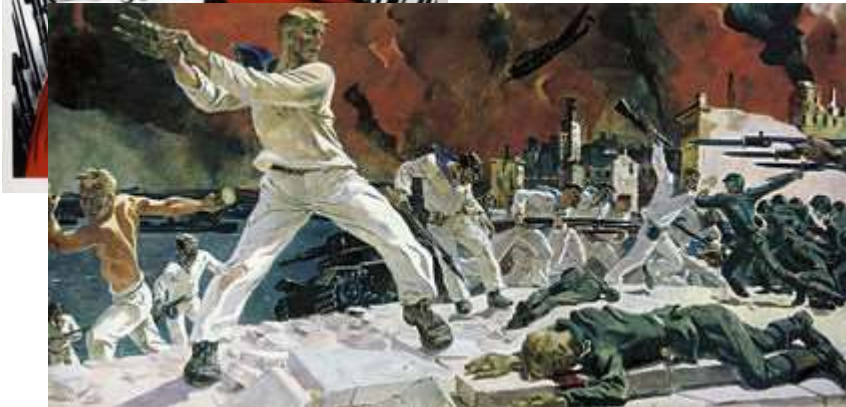
«Оборона Севастополя». А. А. Дейнека. 1942

Изобразительное искусство в годы Великой Отечественной войны рассказывало прежде всего о героизме. Картина Александра Александровича Дейнеки, написанная по впечатлениям автора, который побывал в феврале в обороняющемся Севастополе, демонстрирует самоотверженное мужество советских воинов.