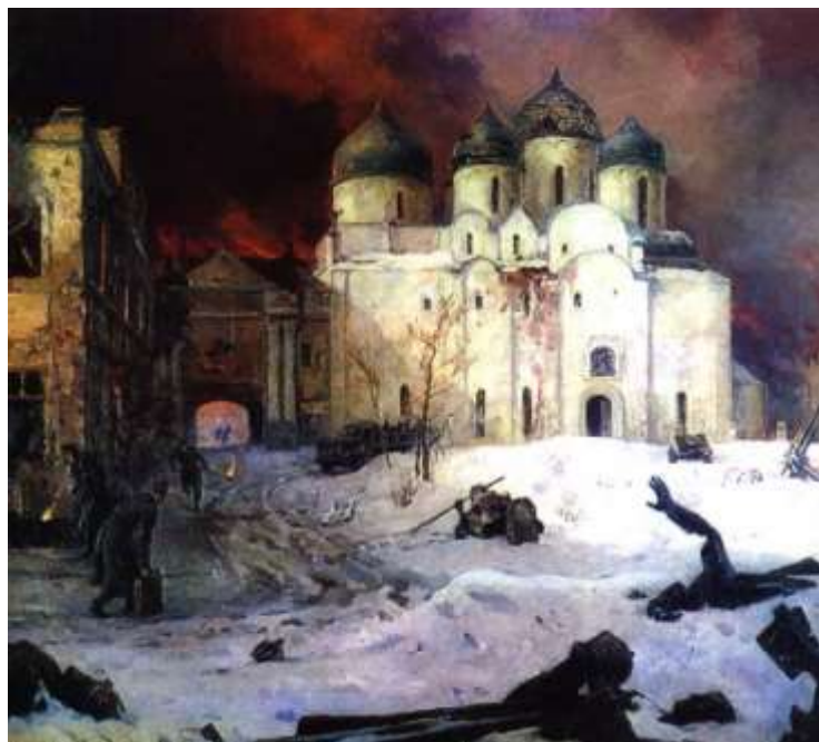
«Бегство фашистов из Новгорода». Кукрыниксы

Наиболее известной из навсегда утраченных культурных ценностей страны стала Янтарная комната Екатерининского дворца-музея в городе Пушкин. Она представляла собой более сотни панно различных размеров, выполненных из янтаря, которые подарил Петру Первому прусский король, а также различные изделия из янтаря XVII–XVIII вв., выполненные русскими, прусскими и польскими мастерами. Ещё в 1941 г. коллекцию вывезли в рейх, где её следы и потерялись. Со временем было обнаружено несколько отдельных предметов, которые вернули в Россию.