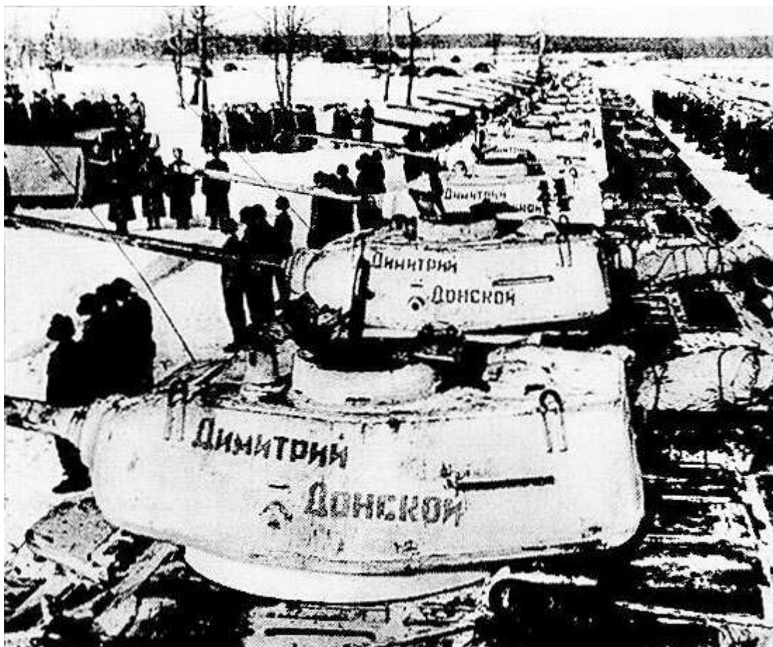
Колонна «Димитрий Донской» в день передачи армии

В 1943 г. официальная государственная политика по отношению к Русской православной церкви резко изменилась. Вернулась единая структура и подчинённость патриарху, а не местным органам власти. Сталин провёл личную встречу с оставшимися на свободе митрополитами, на которой было решено провести церковный собор. На соборе выбрали патриарха — им стал Сергий , в миру И. Н. Страгородский (1867–1944). Был организован специальный Совет по делам Русской православной церкви, который курировал отношения между церковью и государством. Так, без согласования Совета местные власти не могли закрыть ни одного церковного прихода. Были открыты богословские школы, позже ставшие семинариями и академиями. Храмы, открытые на оккупированной территории, продолжали действовать и после её освобождения. К концу войны на территории страны функционировало более 10 тыс. церковных приходов и более сотни монастырей.