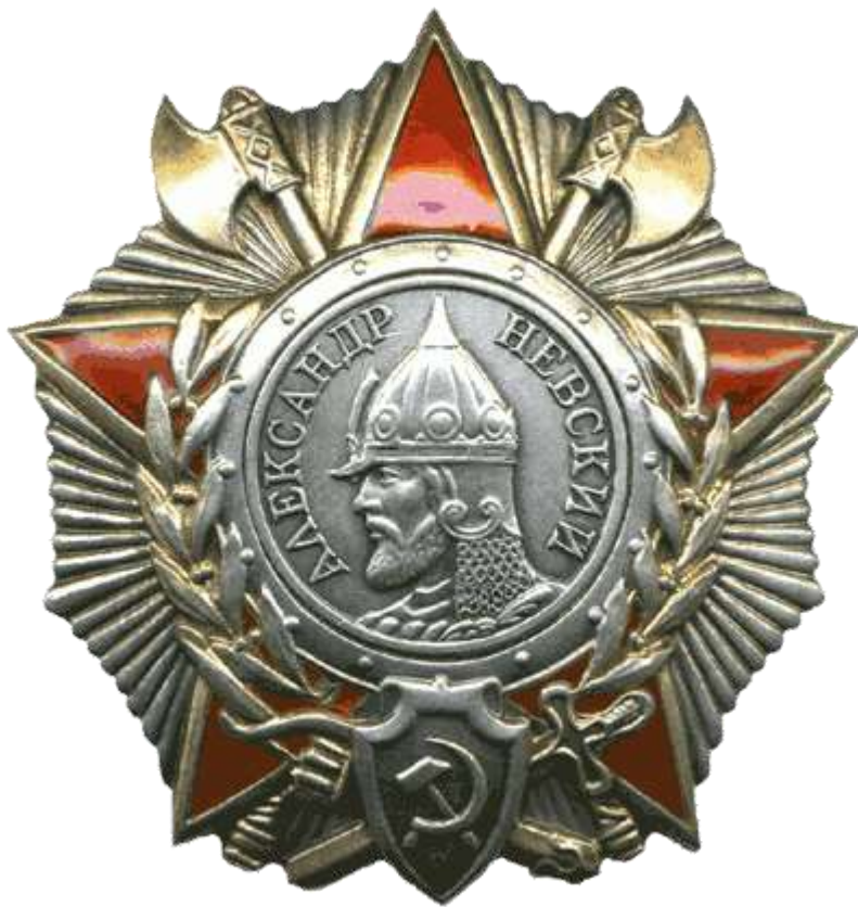
Орден Александра Невского СССР, тип основной, 1942 г.

Голос диктора всесоюзного радио Юрия Борисовича Левитана (1914–1983) поистине стал голосом войны. Он сообщал обо всех крупнейших событиях военного периода, о начале войны и о Победе.