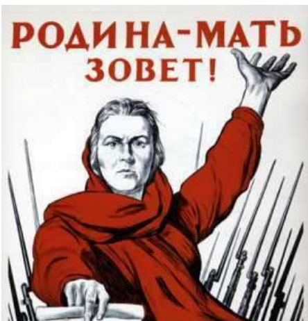
Плакат «Родина-мать зовёт!»

С первых же дней войны никто не смог остаться в стороне от происходящего. Не стали здесь исключением и деятели культуры. Текст песни «Священная война» был опубликован в газетах «Известия» и «Красная звезда» уже через два дня после начала войны. Автор слов этой песни — Василий Иванович Лебедев-Кумач (1898–1949), автор музыки — Александр Васильевич Александров (1883–1946). Ещё одним символом обращения с призывом ко всему народу стал плакат «Родина-мать зовёт!» художника Ираклия Моисеевича Тоидзе.