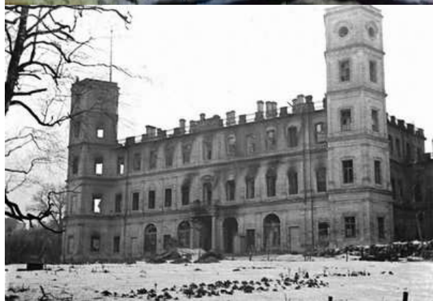
Северный фасад Гатчинского дворца после пожара в 1944 г.

Наиболее известной из навсегда утраченных культурных ценностей страны стала Янтарная комната Екатерининского дворца-музея в городе Пушкин. Она представляла собой более сотни панно различных размеров, выполненных из янтаря, которые подарил Петру Первому прусский король, а также различные изделия из янтаря XVII–XVIII вв., выполненные русскими, прусскими и польскими мастерами. Ещё в 1941 г. коллекцию вывезли в рейх, где её следы и потерялись. Со временем было обнаружено несколько отдельных предметов, которые вернули в Россию.